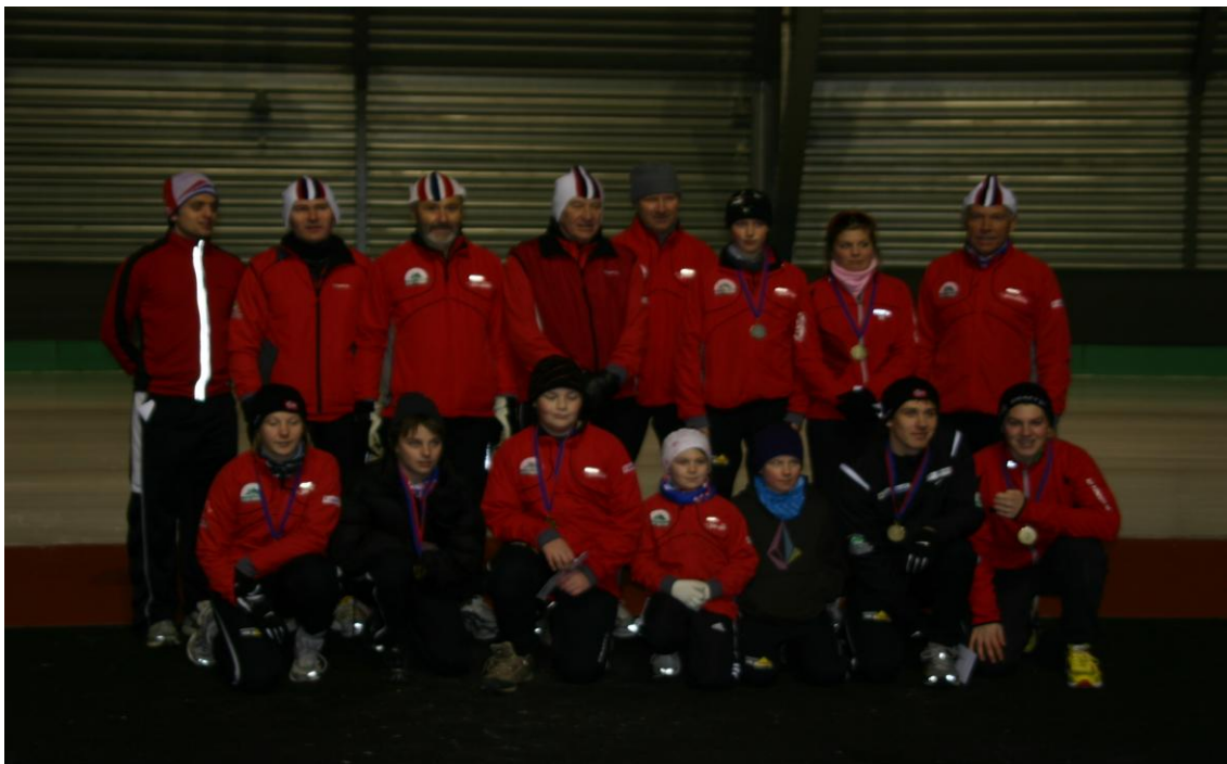
BØSK sine deltakere under KM Sprint i FosenHallen

KM Sprint ble arrangert 13.12. og 14.12.08. Til sammen 71 løpere deltok. 44 av disse var i klassene 11 år og yngre, og deltok ikke i selve kretsmeesterskapet.